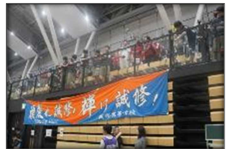
↑応援団。勝利を呼び寄せようと大きな声援を送っていた