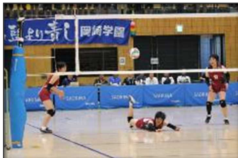
↑失点を許さない。果敢に飛び込む選手。