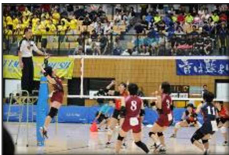
↑力強く飛び上がる選手。迫力満点。