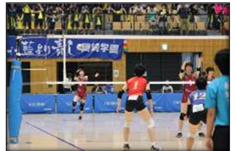
↑緊張の一瞬。サーブを打つ誠修高校の選手。

息の詰まるような戦いの末、惜しくも敗退となったが、選手たちの果敢に立ち向かう姿、そしてバレーボールに真摯に向き合う思いは強く印象に残った。